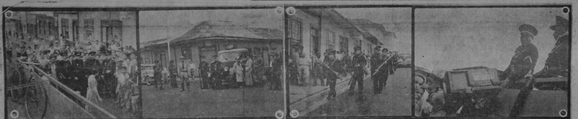
En camiones, la policía nacional recogía el domingo y en la mañana de ayer, la mercadería robada en la noche del sábado. —De izquierda a derecha: En el Barrio de Santa Lucía, la policía recogió una bicicleta robada la noche del sábado.—La siguiente foto muestra el momento en que era custodiada una vivienda de ese barrio mientras se realizaba una inspección para recoger objetos robados.—Cerca de los Molinos del Mauro, actuó ayer la policía.—Un radio de los recogidos a un “vivo” en Santa Lucía.